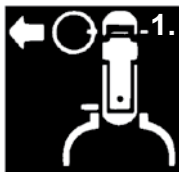
1. Sicherung ziehen