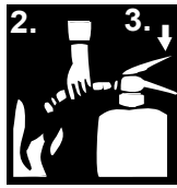
2. Schlauch fassen und Düse aus einem Abstand von 2 - 2,5 m auf den Brandherd richten